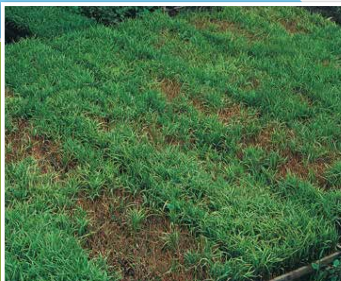
もみ枯細菌病(苗腐敗症)