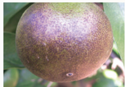
ミカンサビダニ被害