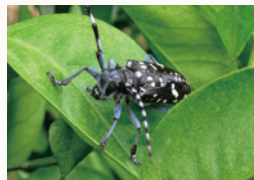
ゴマダラカミキリ成虫