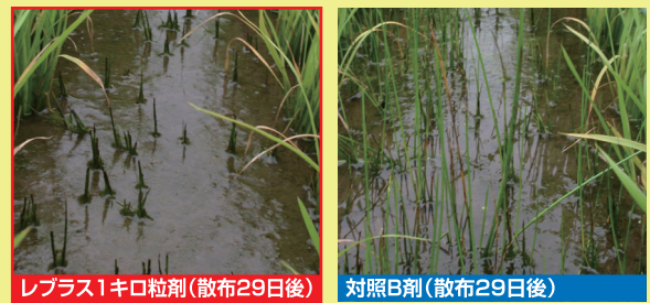
レブラス1キロ粒剤(散布29日後) 対照B剤(散布29日後)