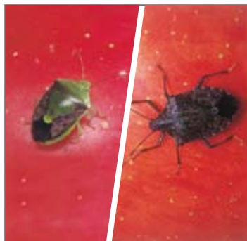
チャバネアオカメムシ/クサギカメムシ