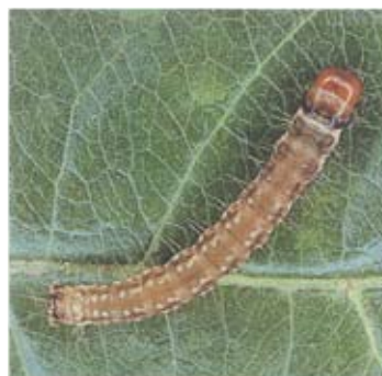
ミダレカクモンハマキ(幼虫)