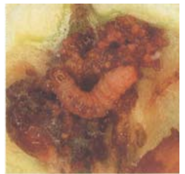
モモシクイガ(幼虫)