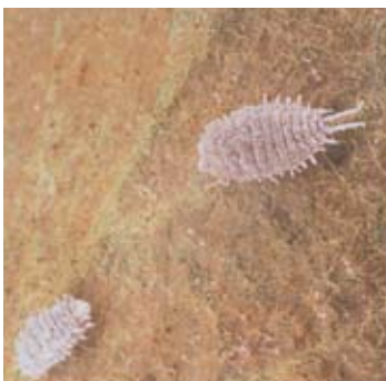
クワコナカイガラムシ